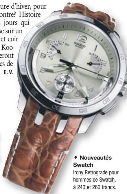
→ Nouveautés Swatch Irony Retrograde pour hommes de Swatch, à 240 et 260 francs.