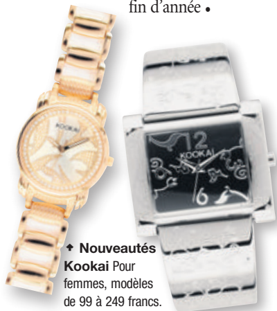
→ Nouveautés Kookai Pour femmes, modèles de 99 à 249 francs.